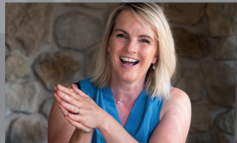
HILDE GERG Ski-Fitness