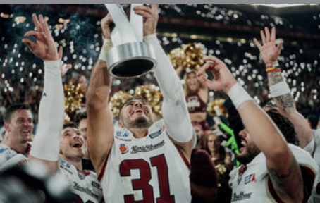
RHEIN FIRE American Football